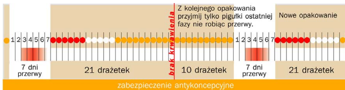
Schemat 2. Środki trójfazowe